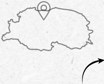
Territoire du Syndicat mixte Environnement SUD LOZÈRE en 2024

Le siège de la nouvelle entité sera localisé à ZA de Julien du Gourg commune de Florac Trois Rivières dans les locaux actuels du SICTOM.